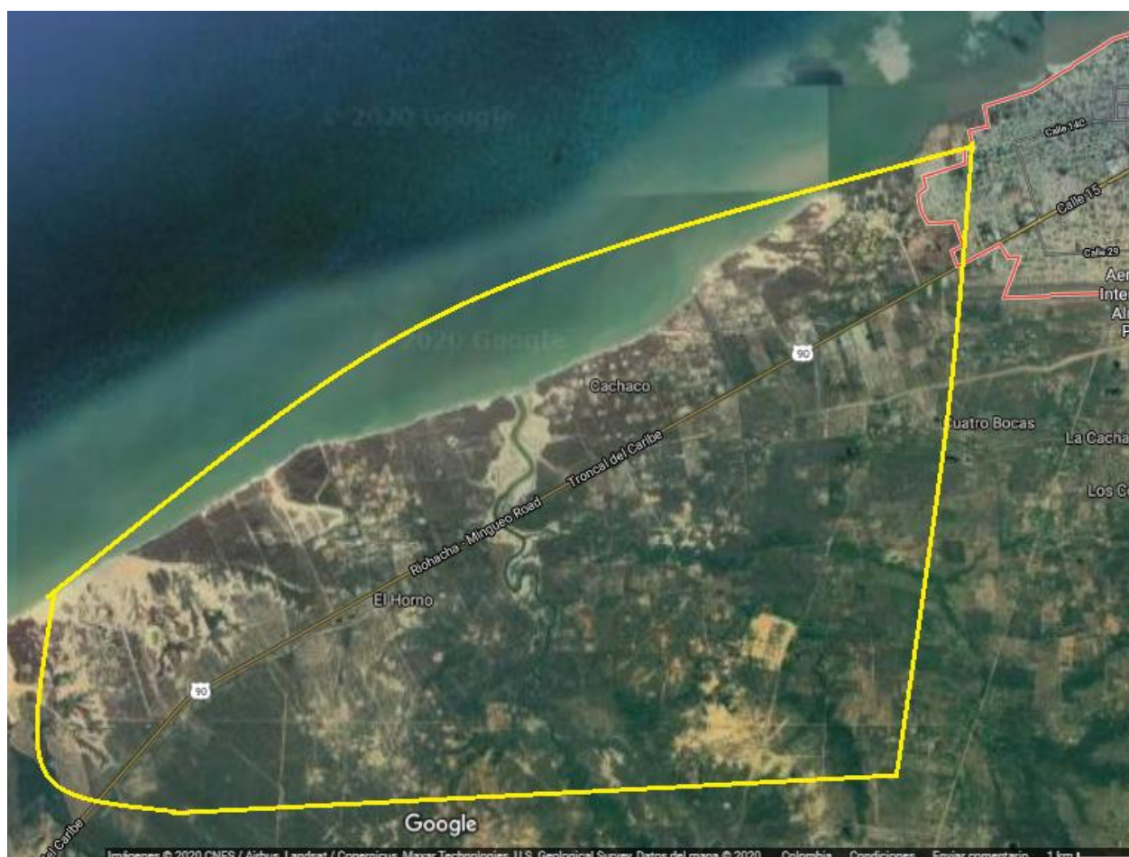
Figura 1. Delimitación de la zona noroccidental del distrito de Riohacha.

De igual manera, este mencionado autor señala la importancia que tiene el territorio para los pueblos indígenas, pues aquél no solo constituye el principal medio de subsistencia, sino que es un elemento fundamental dentro de la cosmovisión, religiosidad, identidad e integridad de la comunidad indígena, y por tanto debe ser considerado como un derecho fundamental y colectivo, lo que una sociedad multicultural, pluralista y democrática, debe respetar y proteger.