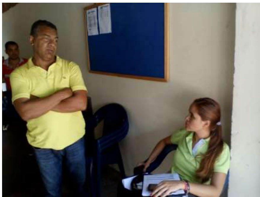
Ilustración 1: Guerra, M. (2018) Cooperativa Coopservig.