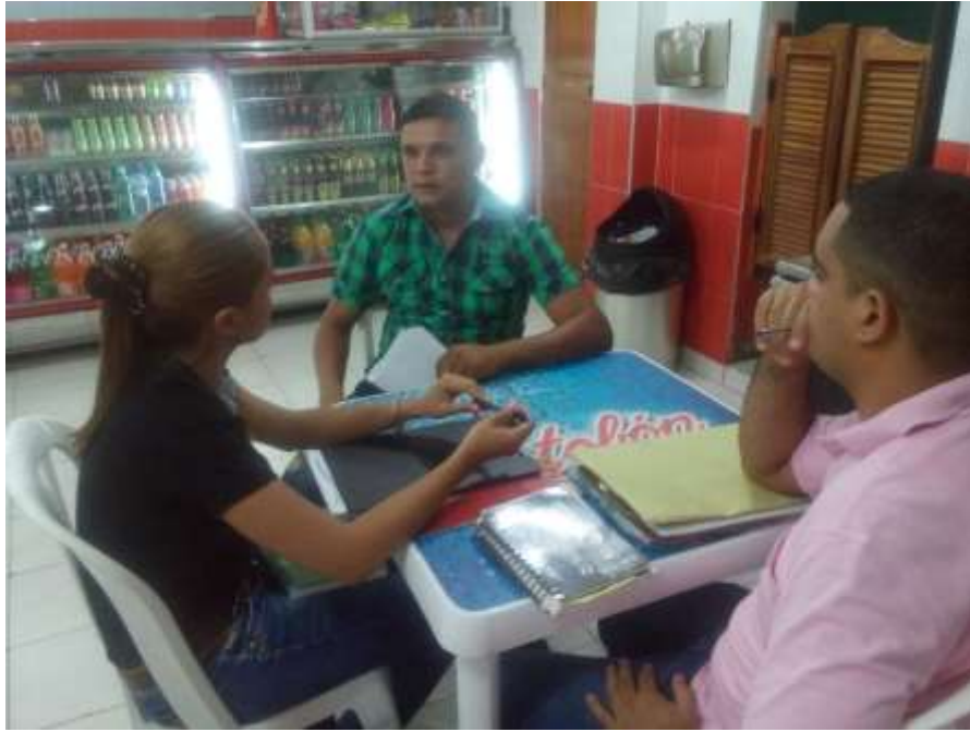
Ilustración 2: Guerra, M. (2018) Líder de los paleros.