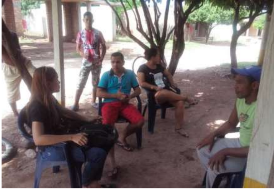
Ilustración 4: Guerra, M. (2018) Dialogo con actores involucrados en la situación conflicto