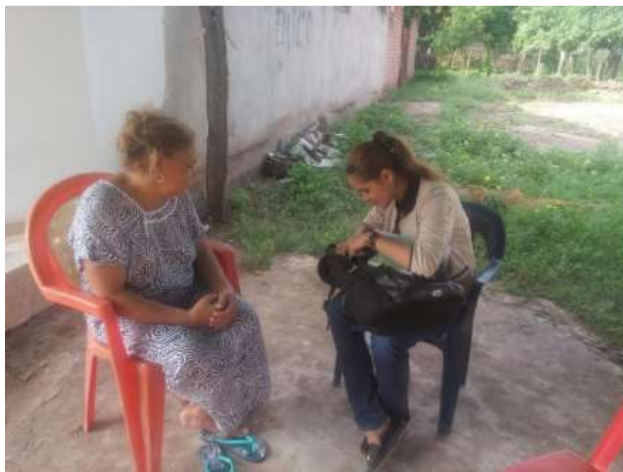
Ilustración 3: Guerra, M. (2018) Entrevista a beneficiaria resolución 216 del 2016