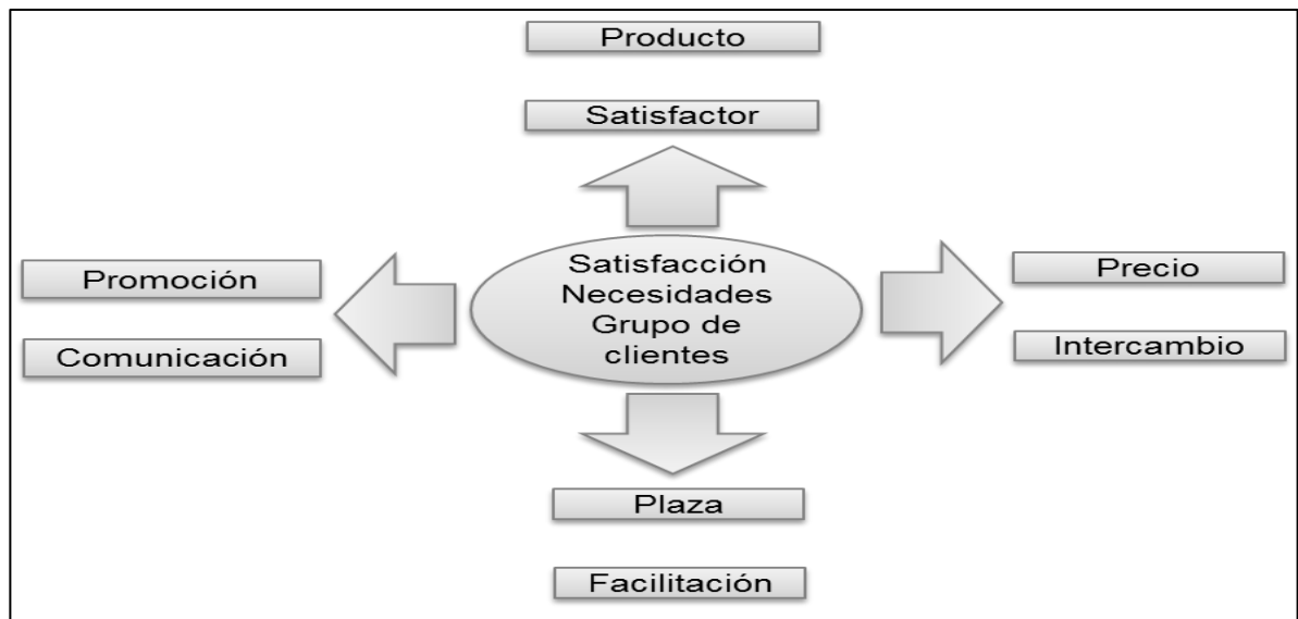
Figura 1. Marketing mix educativo

En este orden, Zapata (2010) expone que, para las organizaciones educativas, se modifican las 4 P's del marketing mix tradicional precio, producto, plaza y promoción; debiendo ser denominadas de la siguiente manera: Satisfactor, Intercambio, Facilitación y Comunicación respectivamente. Así como, se muestra en la figura 1.