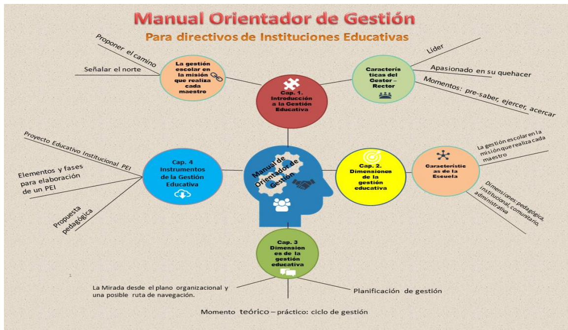
Gráfica No. 2 Estructura para navegar por el Manual Orientador. Liseth Amaya (2020) Construcción propia